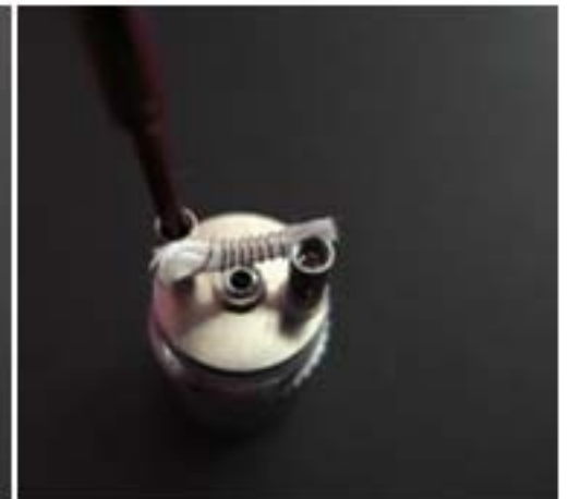
Untere Teil mit Schraubendreher und Heizspirale: linksdrehend= Schraube lösen rechtsdrehend = Festschrauben "bitte nur mit Gefühl schrauben"