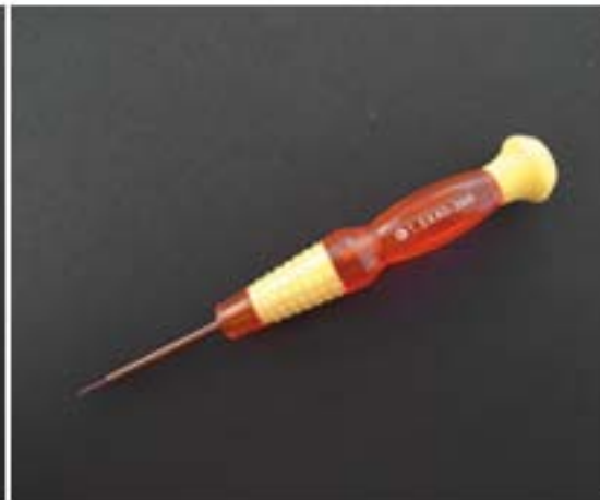
Schraubendreher für Ufo