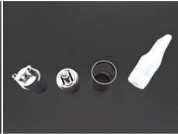
Ufo zerlegt, von links nach rechts: -Untere Teil zur Aufnahme des Heizwiderstandes -Mittlere Teil Dornplatte (mit Docht versehen) -Obere Teil Tankführung -Tank