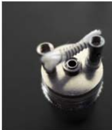
Untere Teil Detailansicht (siehe Skizze Draufsicht)