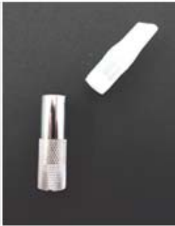
Ufo mit abgezogenem Tank (& speziellen Silikondeckel)